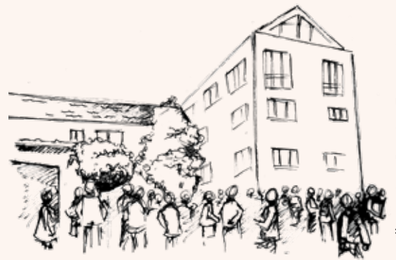
Illustration: Romina Ferrarotti

gestalten Gesundheit in der Gemeinschaft, im Miteinander und im konkreten Lebensraum.